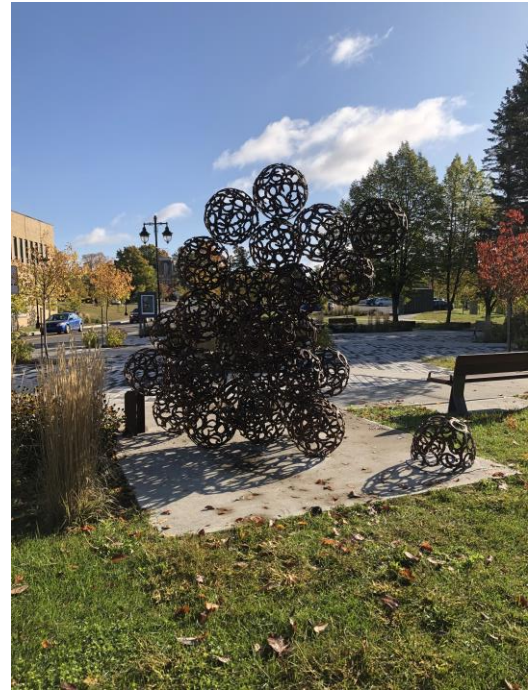
« Entrelacs », LaGaan

Le mandat consiste à concevoir et réaliser une œuvre d'art urbaine en harmonie avec la superficie et l'environnement du site qui l'accueille tout en respectant les directives du projet ci-dessous décrit.