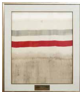
PREMIÈRE VERGE DE SOIE TISSÉE AU CANADA - Bruck Silk Mills, 1922

Le Musée Bruck entreprend de faire découvrir l'histoire ouvrière de Cowansville et de préserver le patrimoine immatériel relié à l'histoire de l'usine Bruck Mills et de l'industrie textile des Cantons-de-l'Est. En vue du centenaire de la filature, le Musée propose de mettre en lien ce patrimoine industriel avec les arts textiles contemporains et de valoriser cet héritage par le biais d'expositions, de documentaires et de programmations qui interpellent les communautés francophones et anglophones de la région.