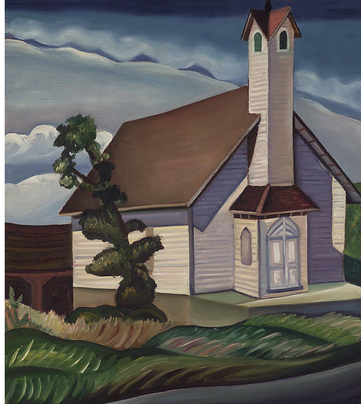
OLD CHURCH, Prudence Heward, 1932