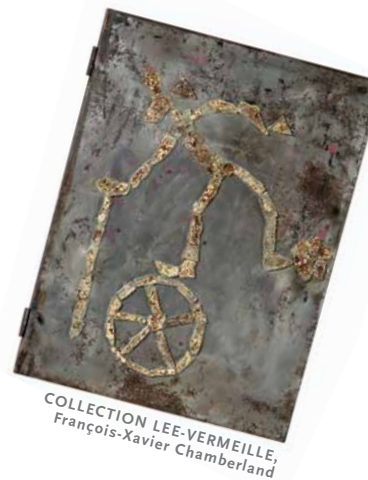
COLLECTION LEE-VERMEILLE, François-Xavier Chamberland