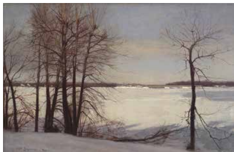
WINTER, William Brymner, 1891

Le Musée accueille régulièrement des expositions en arts visuels présentant des artistes de la région et d'ailleurs ainsi que des expositions collectives ponctuelles.