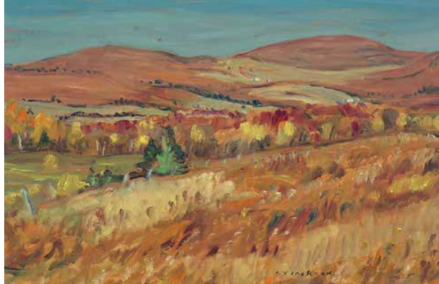
HILLS OF BOLTON GLEN, PQ, A. Y. Jackson